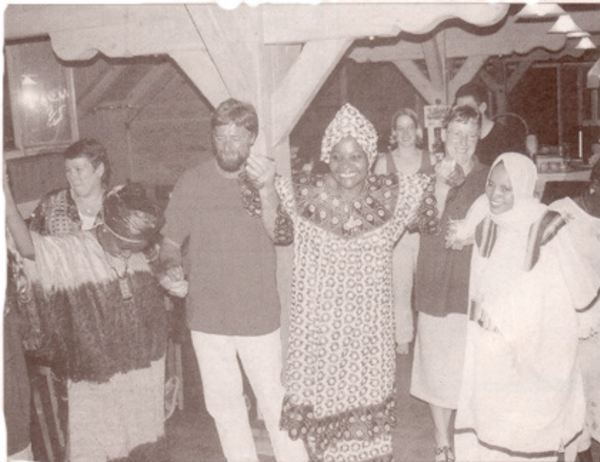
Ansteckende Lebensfreude beim Abschlussfest.